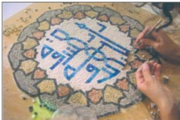
CENTRO INTERNACIONAL, Belén