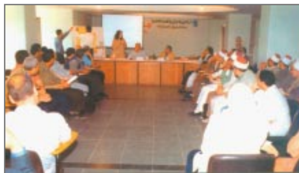
FORO DE DIÁLOGO INTERCULTURAL, Cairo, Egipto

Para más información por favor contactar: H. E. Butt Foundation, P.O. Box 290670, Kerrville, Texas 78029-0670, USA Tel: 830-792-1230 Fax: 830-792-1237 website: www.TheHighCalling.org